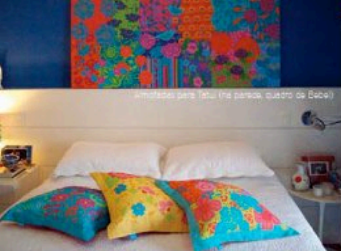
Imitações para Tetu (na parede, quadro de Bebel)

SIM - Você morou em vários lugares no mundo, isto te trouxe toda esta cor?