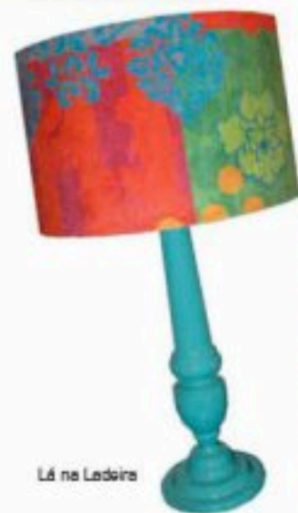
Lá na Ladeira

B.F. - Um desastre! (risos). Não dá pra imaginar, me dá tristeza só de pensar! Cor para mim é imprescindível, é calor humano, é colo, é vida, alegria. Eu preciso de cor como preciso de ar. Parece exagerado, mas não é. Fiz uma viagem ao México no final do ano passado. Em vários momentos ao me deparar com as cores deles meu coração acelerava, achava que ia ter um treco, juro! Foi uma viagem incrível!