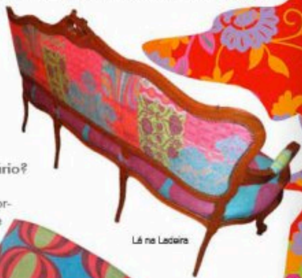
Lá na Ladeira

B.F. - É verdade que é um trabalho puramente feminino. Posso contar nos dedos as vezes que um homem se empolgou com o que eu faço, já as mulheres... Às vezes tenho um pouco de vergonha em não me aprofundar em nada, só pintar flores. Mas é que só de pensar em meter o dedo na ferida já dói. Hoje gosto de pintar flores, estampas, o excesso das duas sobrepostas e muitas cores. Gosto de pintar meus quadros, alegres e simples sem pensar muito na vida. A mulher acho que sou eu, alguém que está sempre querendo se sentir bem, ter prazer. Os quadros são prazerosos, gosto de pensar que as mulheres olhem pra eles e se sintam transbordantes, com vontade de vestir um vestido florido e andar de bicicleta sorridentes por aí.