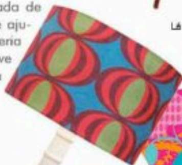
Lá na Ladeira