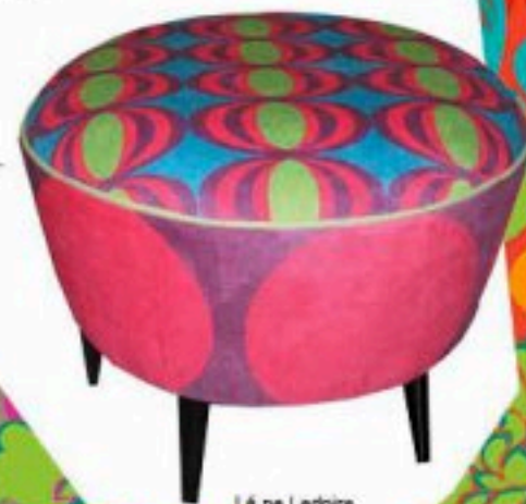
Lá na Ladeira