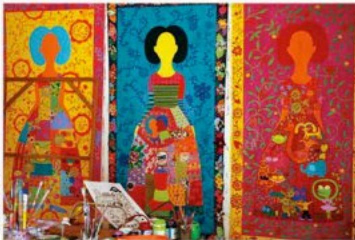
Quadro de Bebel

B.F. - Acho que tanto a França como a Colômbia, os dois países onde vivi mais tempo, reforçaram a paixão pela cor que eu já carregava. Os franceses por mais reservados que sejam curiosamente são megacoloridos, e a Colômbia tem uma cultura popular extravagante. Talvez pela distância do meu país eu quisesse me aproximar dele através da festa, da alegria que eu traduzi em cores.